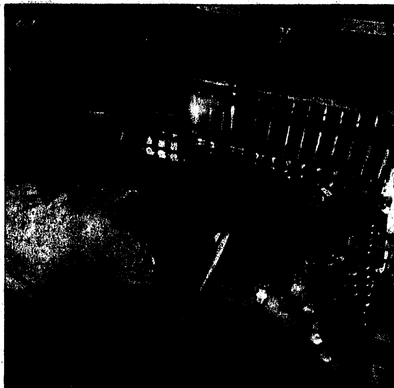
Das Pharmaunternehmen Speedel hat den Börsengang abgesagt.

Vergangene Woche war die Biotech-Firma Arpida mit wenig Erfolg an der Börse gestartet: Am ersten Handelstag verlor der Titel 26 Prozent auf den Ausgabepreis von 18 Franken. Gestern Mittwoch kostete die Aktie noch 14 Franken. Auch die Aktie der seit März 2004 an der Börse kotierten Biotech-Firma Basilea notiert derzeit unter