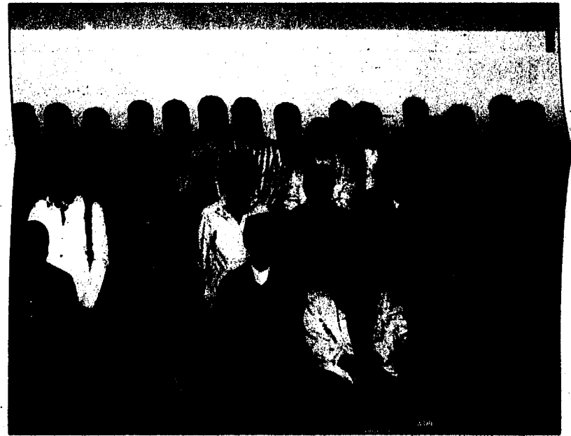
Die Jubilare bringen 670 Jahre LGT-Erfahrung auf ein Bild.