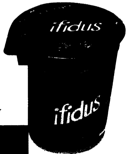
Alle Pro. Bifidus Joghurt Becher à 150 g ~20 günstiger. Beispiel: Pro. Bifidus Erdbeer Becher à 150 g