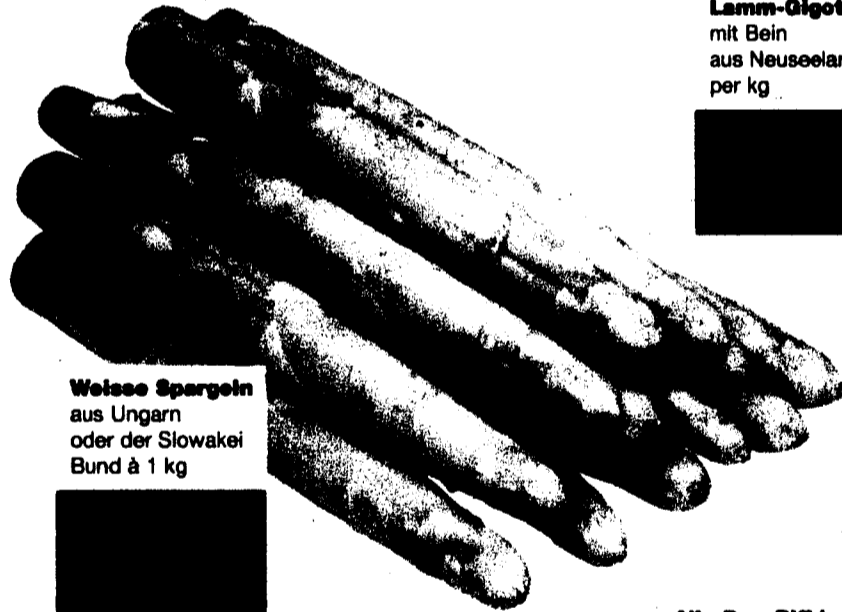
Weisse Spargeln aus Ungarn oder der Slowakei Bund à 1 kg