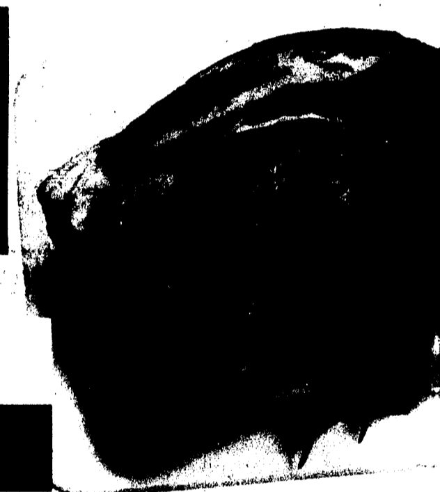
Lamm-Gigot mit Bein aus Neuseeland per kg