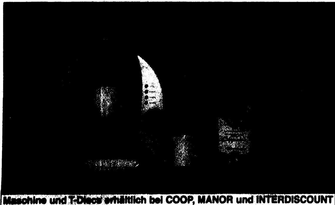
Machine und T-Discs erhältlich bei COOP, MANOR und INTERDISCOUNT

...ein Tassimo Portionensystem im Wert von CHF 249.-