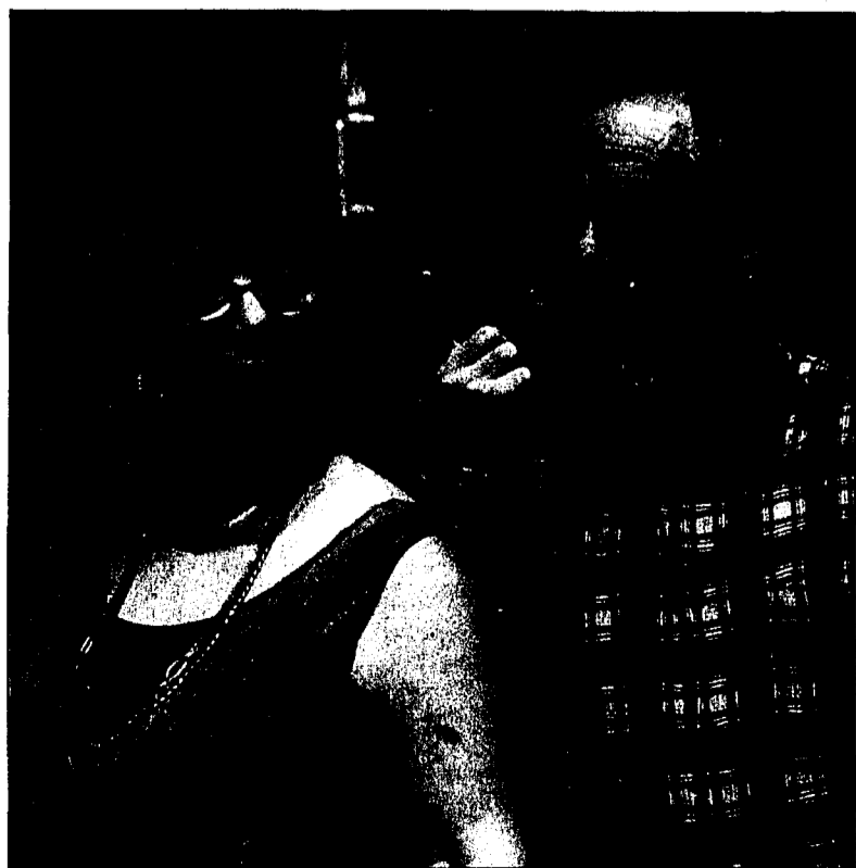
Es herrscht ein rauher Ton – aber nur im Theater.