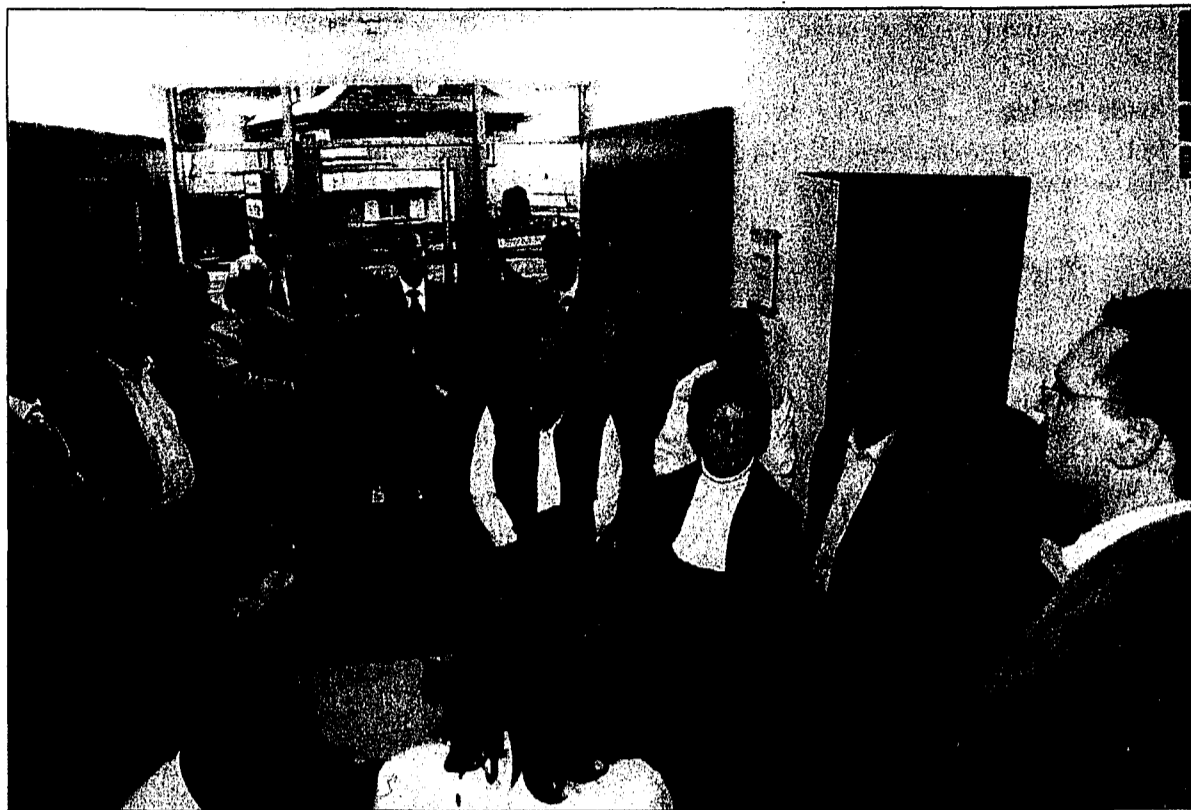
Willkommen beim Liechtensteiner Volksblatt: Die FBP-Landtagskandidaten sind neugierig darauf, zu wissen, wie ihre Lieblingslektüre Tag für Tag druckfrisch entsteht.

Es sei beeindruckend, so das Kompliment des FBP-Kandidatenteams, dass mit diesen kleinen personellen Ressourcen jeden Tag ein