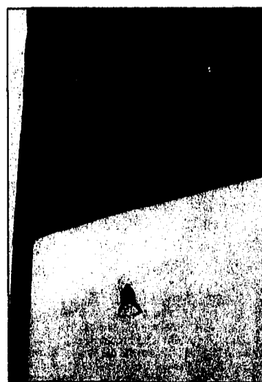
Nebel verhinderte ein Abschlussstraining für die morgige Abfahrt.

Dass gestern das Abschlussstraining für die morgige Abfahrt abgesagt werden musste, «im unteren Teil war eine Nebelsuppe», kam «Büx» sogar entgegen: «Somit konnte ich Kraft sparen und habe für die Abfahrt eine sehr gute Nummer.» Weil am Samstag in umgekehrter Reihenfolge der Weltrangliste gestartet wird, geht der 33-Jährige mit 14 oder 15 ins Rennen.