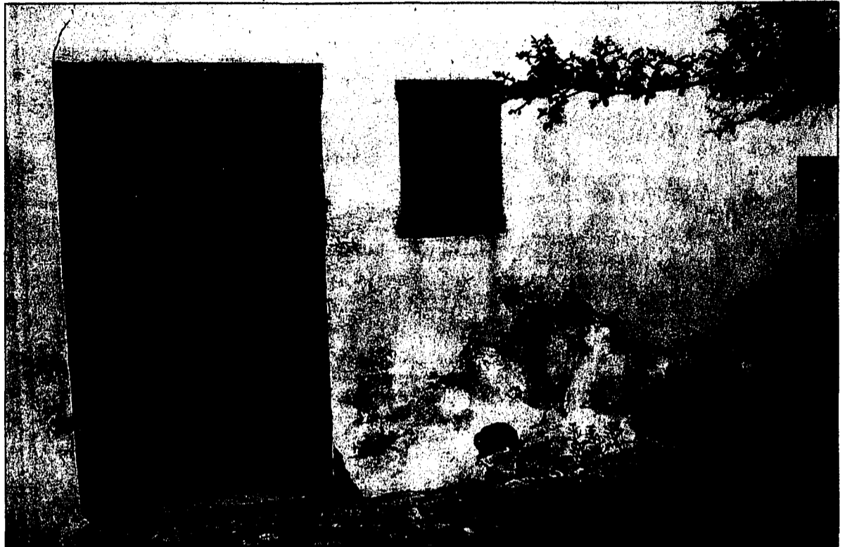
Im Mauerwerk aufgestiegenes Wasser verursacht sichtbaren Schaden. Remo Guntli und sein Team sind Ansprechpartner für diese Probleme.

Remo Guntli, Landstrasse 100 in Vaduz, und seine Mitarbeiter beraten Sie gerne unter Telefon 00423/232 37 63 oder 079/222 00 09. Zusätzliche Informationen finden Sie im Internet unter www.remoguntli.li . (Anzeige)