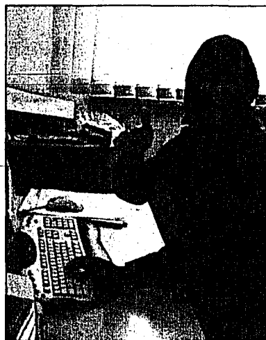
Spielen Sie mit um den Titel «Intelligentester Kopf Liechtensteins».

Die körperliche wie auch die geistige Fitness sind ein Garant dafür, dass der Mensch bis ins hohe Alter ein beschwerdefreies und glückliches Leben führen kann. Das Liechtensteiner Volksblatt