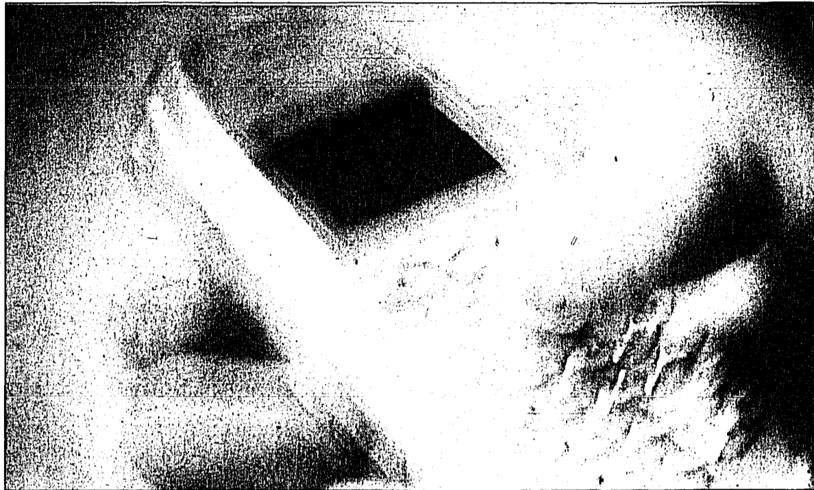
Über 130 000 Prepaid-Kunden von Swisscom können vorübergehend nicht mit dem Handy kommunizieren.

BERN – Die Swisscom hat 130 000 Prepaid-Kunden die Handys abgeschaltet. Vielen Kunden von Orange und Sunrise ist es gleich ergangen. Sie alle haben sich bis Ende Oktober nicht registrieren lassen und haben auch die «Gnadenfrist» bis Ende November nicht genutzt.