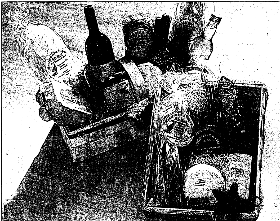
Das Sortiment ist umfangreich. Übrigens, das «Bangshofkörbe» ist eine gute Geschenkidee.

Es sind Produkte aus der engeren Heimat, sie sind einige Zeit haltbar, können aber auch sofort genossen werden. Sie haben keine langen Transportwege und werden individuell, ganz nach den Wünschen des Schenkenden zusammengestellt. Von den verschiedenen Käsesorten, selbstverständlich aus der hofeigenen Käserei über frische Eier von Hühnern aus den grossen Freilaufgehegen bis zu Teigwaren aus der eigenen Produktion, Bienenhonig oder Sirupspezialitäten, Hochprozentiges aus Liechtenstein oder ein gepflegter Wein, ebenfalls aus heimischen Rebbergen, die Körbe sind für jeden Beschenkten eine Freude.