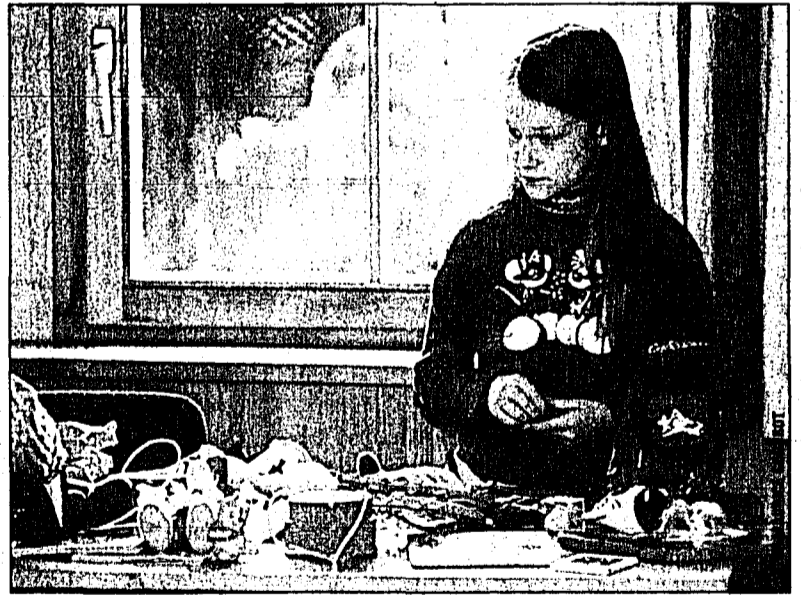
Und auch diese junge Dame hatte einiges zum Verkauf zu bieten.