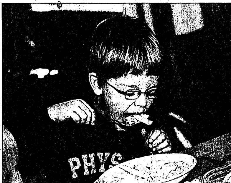
Natürlich war auch für das leibliche Wohl bestens gesorgt.