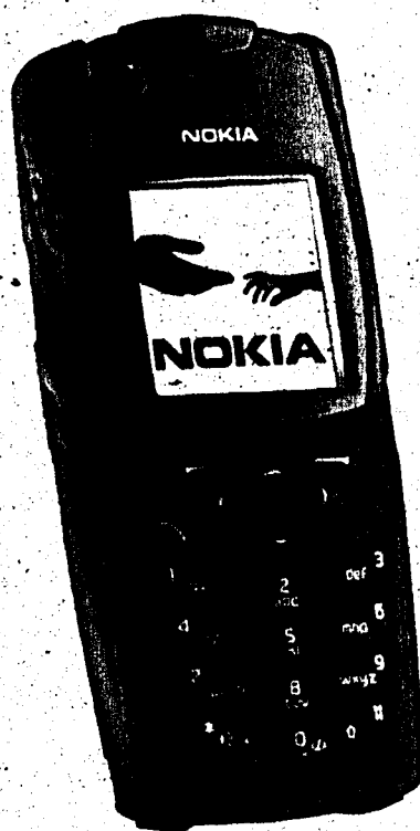
Das Nokia 5140 bietet Schutz vor Spritzwasser, Staub und Erschütterungen. Gleichzeitig dient es als Fitness-Coach.

X70 Panasonic: Es ist clever und dabei elegant, klein und zugleich gross in der Wirkung: das neue Aufklapp-Handy X70 von Panasonic hat von allem nicht nur ein bisschen, sondern sogar jede Menge. Das 39 mal 29 mm grosse Display ist erstklassig und kann bis zu 65 000 Farben darstellen. Das Highlight des X70 ist jedoch seine Kamera. Bisher einzigartig ist dabei das integrierte Fotolicht. Abgelegt werden die Fotos im vier MB grossen dynamischen Spiel-