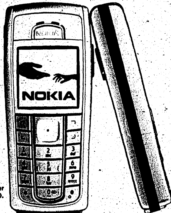
Der Testsieger Nokia 6230.