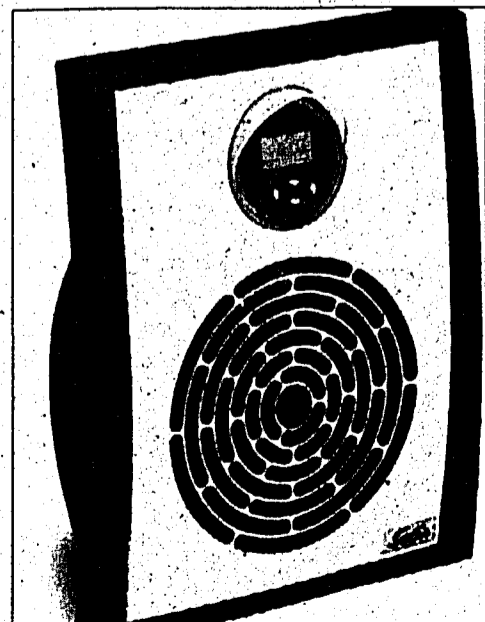
Der Solis Rhapsody Metallic ist im Fachhandel erhältlich.

GLATTBRUGG – Die neuen Heizlüfter von Solis sind so diskret, dass der geneigte Betrachter Musik erwartet – aber wohlthuende Wärme erhält. Beides ist schön. Die unscheinbaren Geräte können dank dem tropfwassergeschützten Gehäuse auf dem Boden stehend oder an der Wand montiert gefahrlos eingesetzt werden. Eines der Wundergeräte ist der Solis Rhapsody Metallic mit regulierbarem Thermostat und Digital-Zeitschaltuhr. Er brilliert besonders durch seine matt satinierte Aluminium-Front. Technische Daten: 2 Leistungsstufen mit Kontrollanzeige, regulierbarer Thermostat, Frostschutzstellung, Überhitzungsschutz, tropfwassergeschützt, Masse 26 x 31 x 15 cm, Leistung 1000/2000 Watt. (PD)