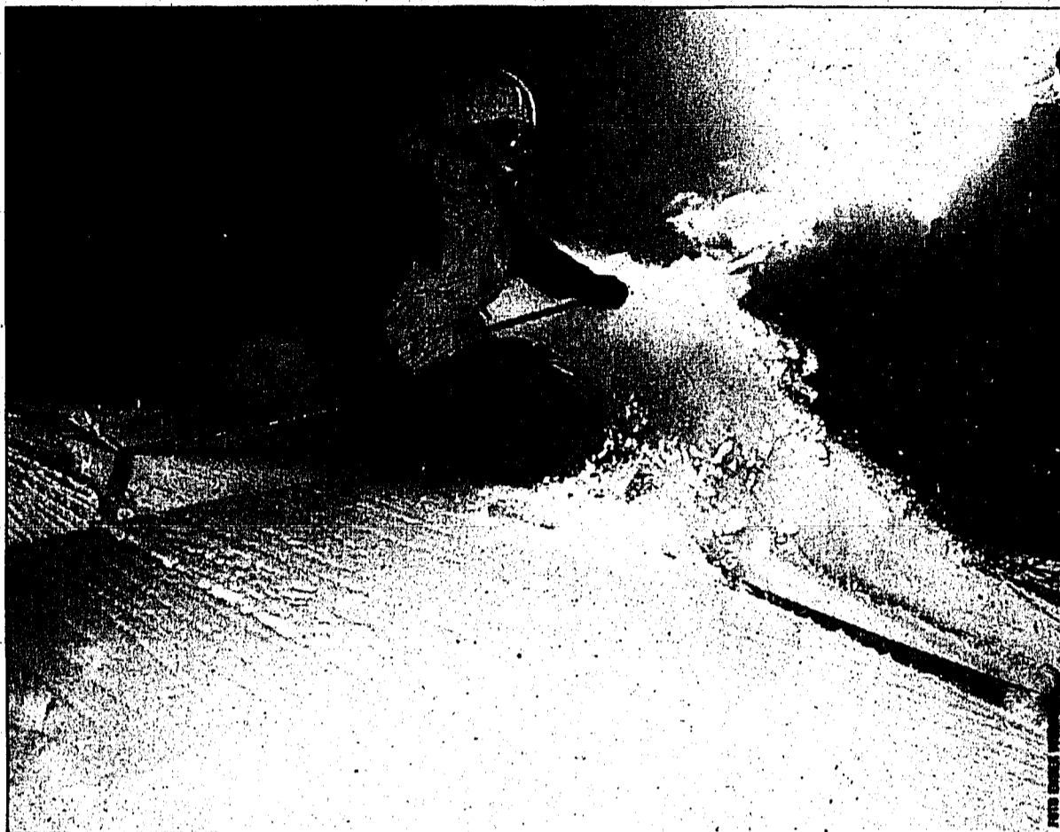
Damüls, das Pistenparadies, steht für Schneesicherheit, Qualität und Komfort.

Zirka zehn Prozent verbilligte Saisonkarten sind noch bis 12. Dezember zu erwerben. Damüls gehört zur Drei-Täler-Tarifgemeinschaft. Kenner nutzen mit dem Drei-Täler-Superpass 162 Bahnen und Lifte im Bregenzer Wald, im Grossen Walsertal und im Lechtal. In der Saison 2004/2005 gibt es nun erstmals die preiswerte Drei-Täler-Familienjahreskarte. 2 1/2-Tages-Skipässe, flexible Mehrtagesabos für zwei, fünf oder acht Tage zum Spezialtarif, die tageweise abgebucht werden, ergänzen das umfangreiche Angebot. Seit dem letzten Jahr hat Damüls ein neues Kar-