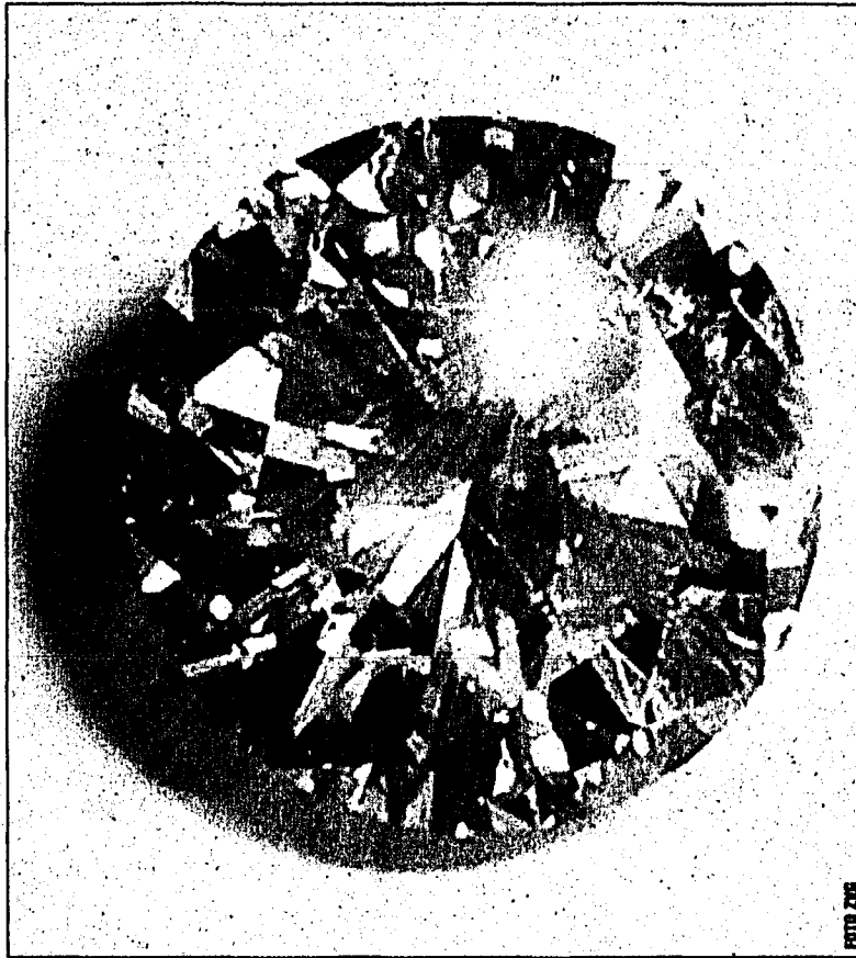
Gewinnen Sie am Wochenende einen Brillanten in Vaduz.

Jeder Besucher der Schmuckausstellung nimmt automatisch an der Verlosung eines Brillanten teil. Fachleute beraten Besucherinnen und Besucher nicht nur beim Schmuckkauf sondern auch bei Umbearbeitungswünschen. Das heisst, alte Schmuckstücke können mitgebracht werden und Fachleute helfen, daraus etwas Neues zu gestalten. Weitere Infos zu Schmuckausstellung gibt es auf dem heute dem Volksblatt beigelegten Flyer. Machen Sie jetzt auch beim 500 Franken-Gewinnspiel mit. Die Infos dazu finden Sie in der grünen Factbox. (PD)