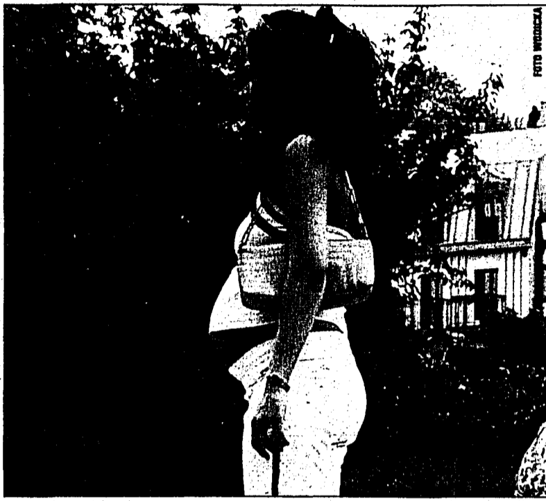
Wer schwere Akne behandeln will, darf nicht schwanger sein.

In der Schweiz unterliege die Abgabe von Roaccutan bereits sehr