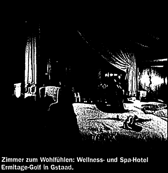
Zimmer zum Wohlfühlen: Wellness- und Spa-Hotel Ermitage-Golf in Gstaad.