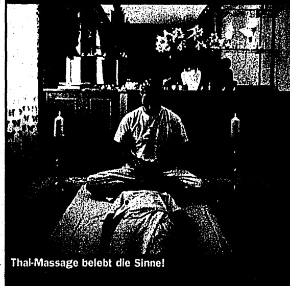
Thal-Massage belebt die Sinne!