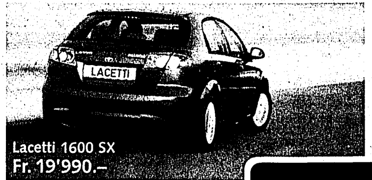
Lacetti 1600 SX Fr. 19'990.-

Mit unseren Modellen Matiz 1000, Lacetti, Nubira Station und Tacuma fahren Sie diesen Winter gut gerüstet in den Schnee! Entscheiden Sie sich jetzt für eines dieser Modelle, erhalten Sie Ihren Neuwagen inklusive 8 kompletten Rädern. Sämtliche Modelle bekommen Sie inklusive Klimaanlage, Radio/CD, ABS sowie Airbags für Fahrer und Beifahrer. Bei den meisten sind zudem Seitenairbags mit dabei.