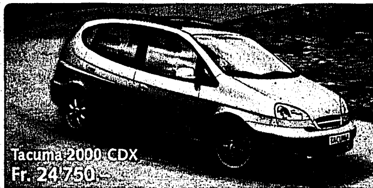
Tacuma 2000 CDX Fr. 24'750.-