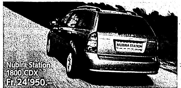
Nubira Station 1800 CDX Fr. 24'950.-