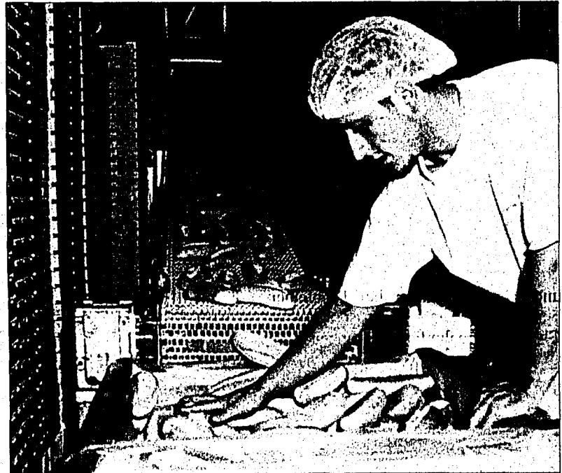
Tiefgefrorenes wird verpackt und zum Palettieren vorbereitet.

Grundsätze der Q-Politik sind die Flexibilität und das innovative Handlungsvermögen sowie die ausgereifte und intakte Infrastruktur. Diese stellen sicher, dass der Kunde stets qualitativ hochwertige Produkte zu marktgerechten Preisen erhält. Die Wohlwend AG garantiert prompte, zuverlässige und vollständige Leistungen. Gegenüber den Angestellten wird eine offene und interne Kommunikationspolitik betrieben. Der kooperative, partizipative Führungsstil, auf den die beiden Wohlwend-Brüder grossen Wert legen, fördert das Verantwortungsbewusstsein der Mitarbeiter. Im Zuge der Weiterentwicklung ist es unabdingbar, Prozessabläufe immer wieder zu überdenken, zu verbessern und zu harmonisieren, um stets eine Kontinuität und Stabilität zu gewährleisten. (HN)