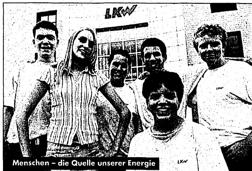
Menschen – die Quelle unserer Energie

Wir versorgen Liechtenstein mit Strom und Dienstleistungen rund um die Energie und Telekommunikation. Wir möchten uns auch in Zukunft in diesem sich rasch verändernden Umfeld als führender Dienstleister positionieren. Unsere Zukunft sind junge Menschen, und deshalb bieten wir Dir eine gute fundierte Ausbildung, welche Dich für das weitere Berufsleben rüstet.