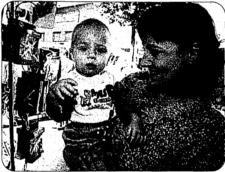
Keiner zu klein, ein Jahrmarktbesucher zu sein.