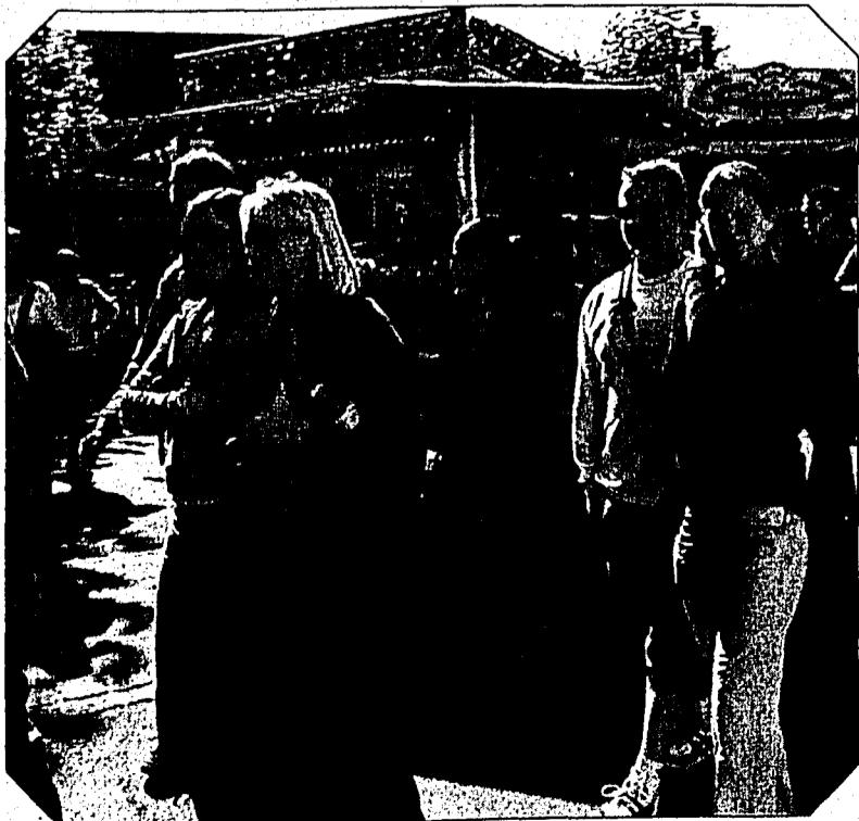
Einfach nur flanieren und schauen, wer sonst noch so da ist ...