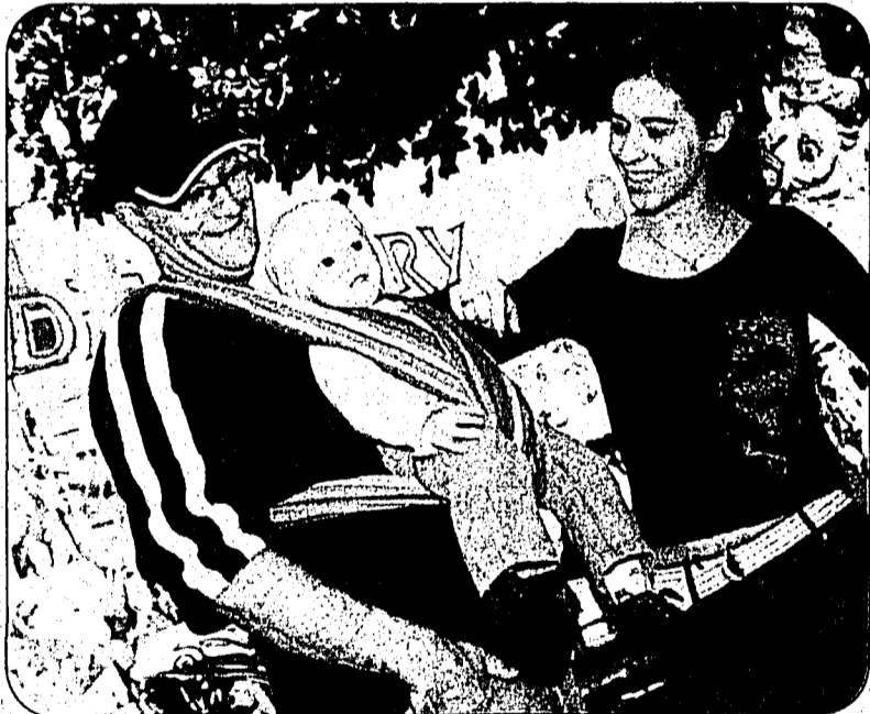
Dieser junge Zeitgenosse braucht noch keine wilden Bahnen.