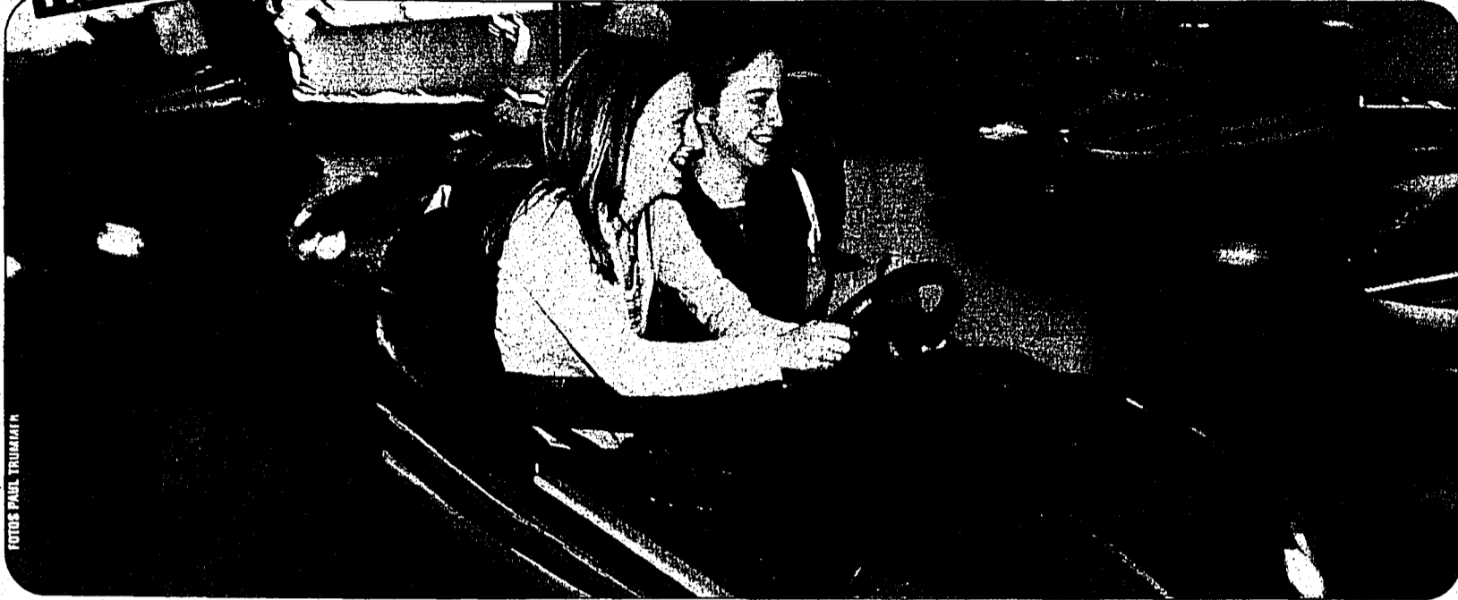
Diese zwei Teenager vergnügen sich beim pflichtgemässen «Tütschäutle»-fahren am Vaduzer Jahrmarkt.

Gute Stimmung und schönes Wetter am Vaduzer Jahrmarkt