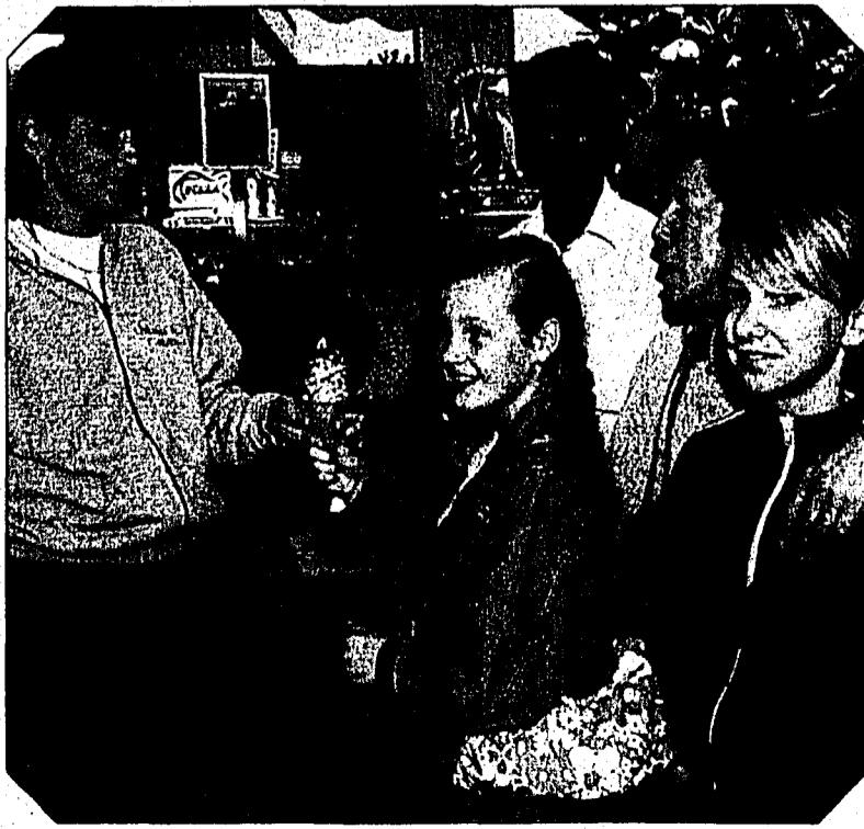
... oder ein feines Eis schlecken. Jedem das Seine halt.