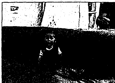
Auch die Kleinsten hatten Spass.

Alle Bilder unter www.VOLKSBLATT.li «Volksaktionen»