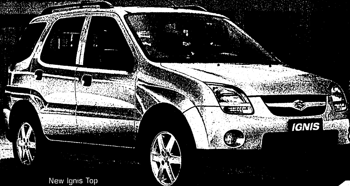
New Ignis Top