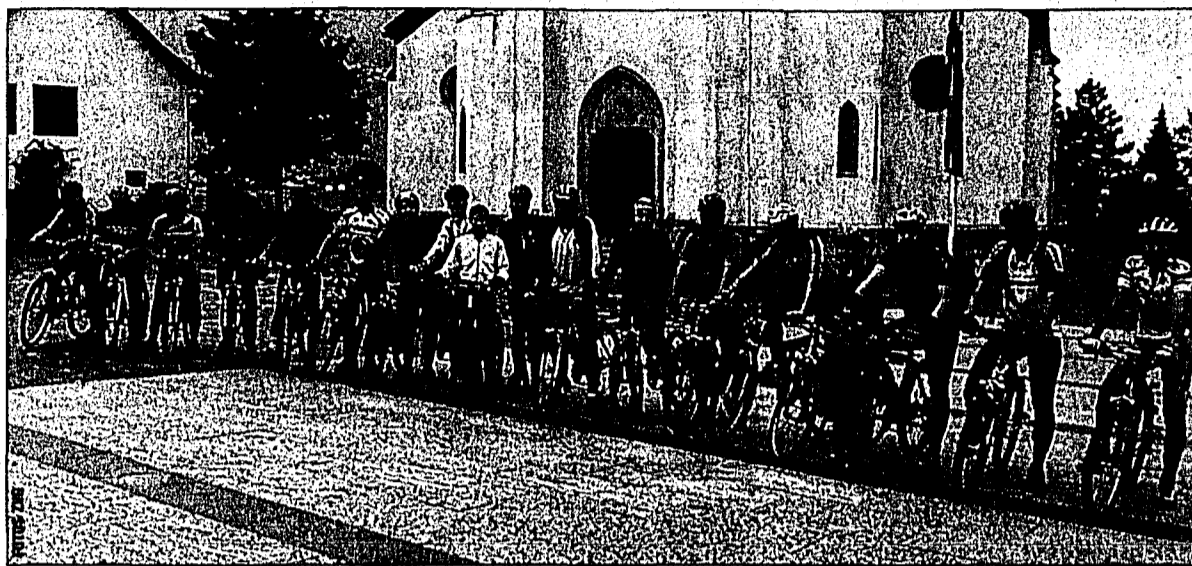
Die einzelnen Gruppen kurz vor dem Start und alle zusammen beim geselligen Teil (Bild ganz unten).

Unter der Leitung von Angelika Marxer und Werner Lang jun. nahmen die Radler ihre knapp 20 km lange Fahrstrecke in Angriff. Die Tour führte vom Dorfplatz zum