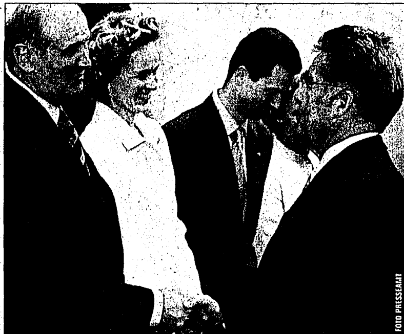
Bundespräsident Heinz Fischer begrüsst Regierungschef Otmar Hasler ...