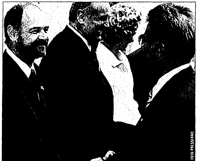
... und Aussenminister Ernst Walch im Schlosshof.