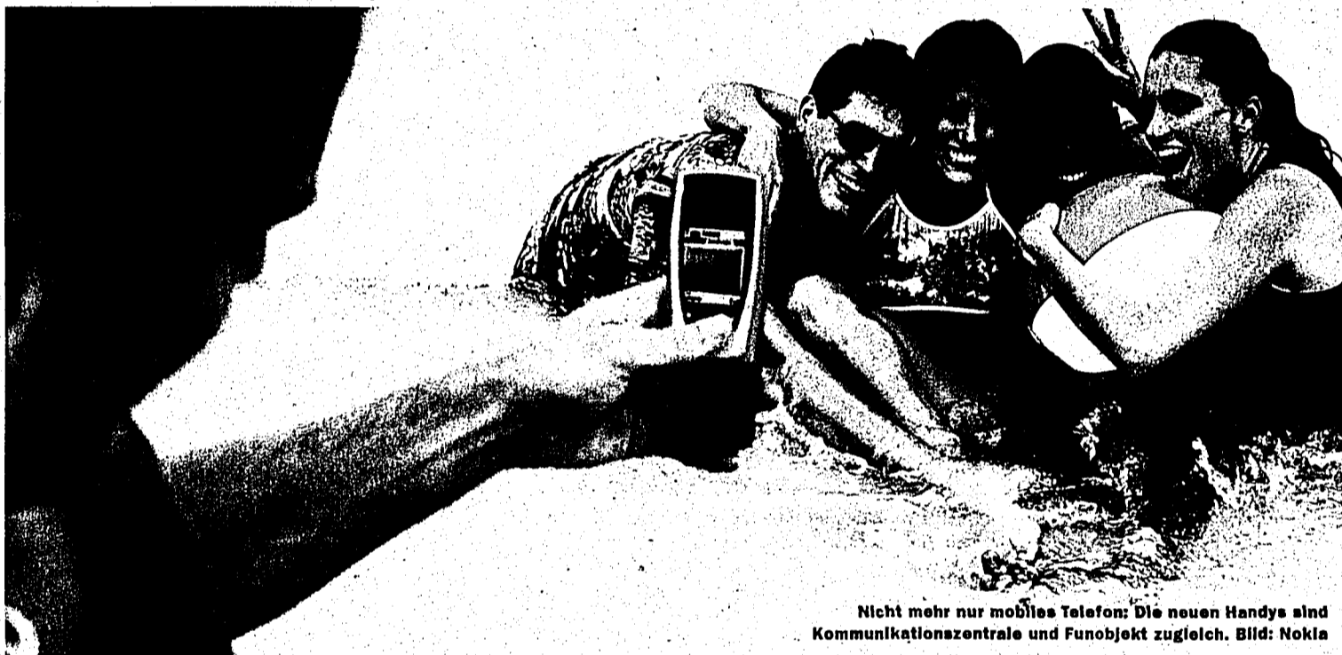
Nicht mehr nur mobiles Telefon: Die neuen Handys sind Kommunikationszentrale und Funobjekt zugleich.