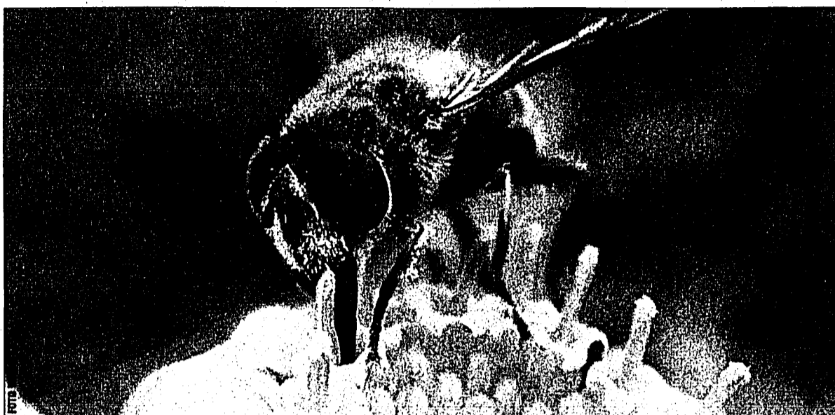
Bienenstiche sind für Nichtallergiker zwar schmerzhaft, aber ungefährlich.

Die durch geflügelte Insekten hervorgerufenen Stiche dagegen sind zwar unangenehm, dafür aber meist ungefährlich. Reagiert der Körper jedoch allergisch auf das In-