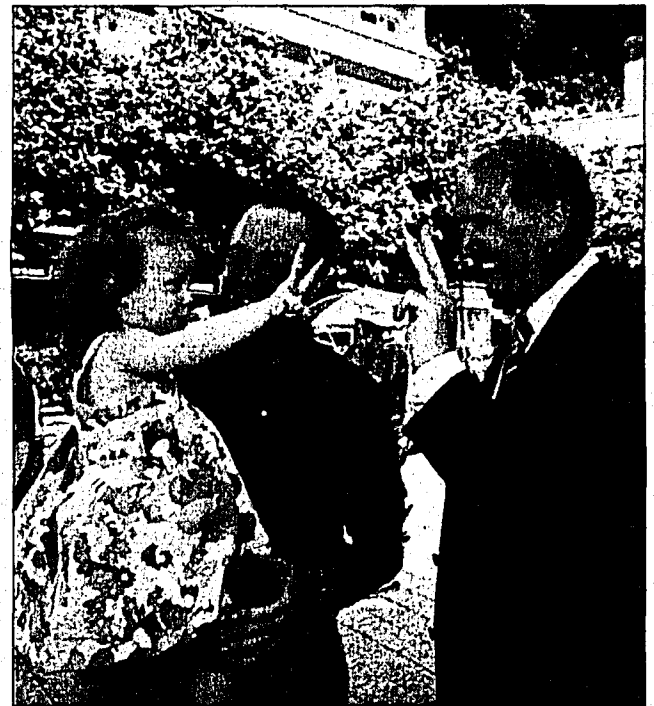
Regierungschef Otmar Hasler nahm gestern nicht nur Grüsse von grossen Persönlichkeiten entgegen.