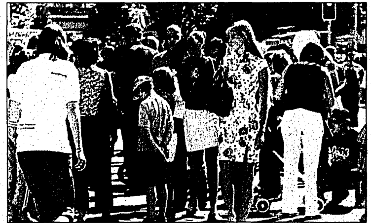
Schönes Wetter bescherte den Besuchern in Vaduz schöne Anblicke.