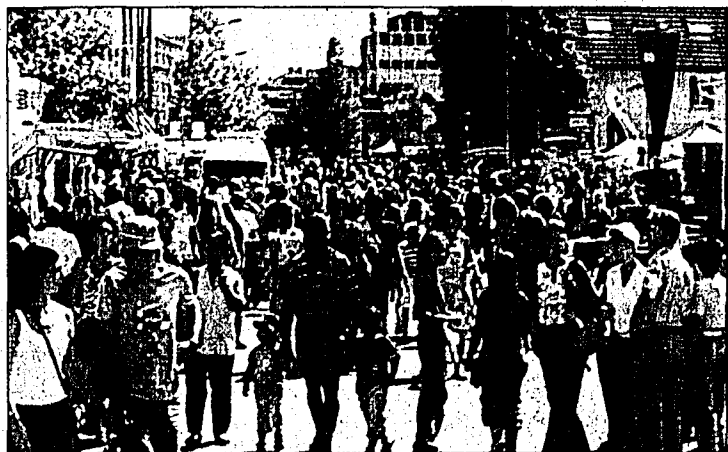
Hohes zweibeiniges-Verkehrsaufkommen im Vaduzer Städtle.