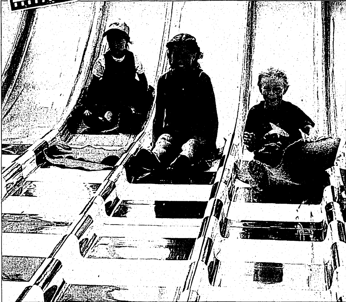
Reibungsloser Spass, welcher die Augen der Kleinsten zum Leuchten brachte.

Wir setzen Liechtenstein ins Bild Noch mehr Bilder: www.volksblatt.li