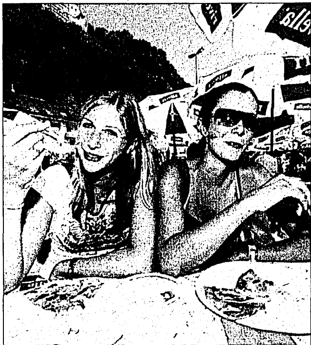
Zwei sonnenhungrige Junge Damen beim genüsslichen «Festmahl».