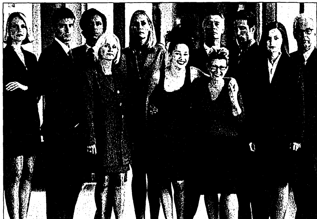
Mehr Sicherheit beim Personalentscheid mit dem DISG-Persönlichkeits-Profil.

DISG ist ein praxiserprobtes, wissenschaftlich ausgereiftes, psychometrisches Selbsteinschätzungsinstrument, das weltweit von vielen Unternehmen täglich mit Erfolg eingesetzt wird. Die Anwendung ist im Vergleich mit anderen Verfahren einfach und äusserst effizient. Die betreffende Person füllt einen Fragebogen mit 24 Wortgruppen à 4 Adjektive aus. Das