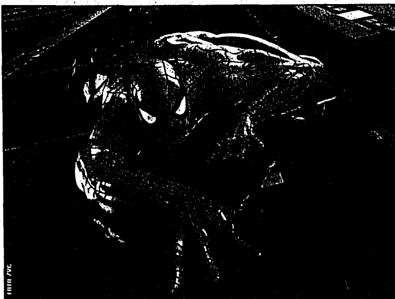
Spiderman 2 hat 200 Millionen Dollar an Produktionskosten verschlungen.