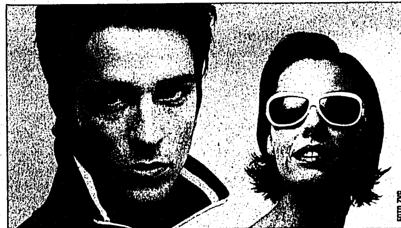
Klare Sicht und ein neues Image mit Kontaktlinsen und Sonnenbrillen von Federer Augenoptik AG in Buchs und Triesen.

Infos auch unter www.federer- augenoptik.ch . (visus service)