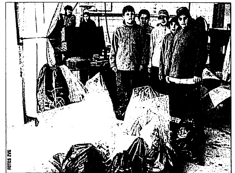
Schülerinnen und Schüler mit einem Teil des gesammelten Unrates, den sie selbst in die KVA nach Buchs gebracht haben.

auf dem Gemeindegebiet achtlos weggeworfene Abfälle ein. Die gesammelte Abfallmenge war nicht unerheblich. Anschliessend wurden an drei Posten durch die Werkbetriebsmitarbeiter diverse Umweltthemen, welche die Gemeinde betreffen, aufgegriffen und mit den Kindern diskutiert. Nach dem Mittagessen im Werkhof stand am