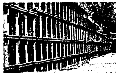
6000 m 2 Spundbohlen

Edwin Vogt & Söhne AG, Im alten Riet 21, FL-9494 Schaan Telefon +423 235 08 60, Fax +423 235 08 69