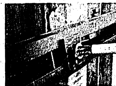
250 wiederausbaubare Anker