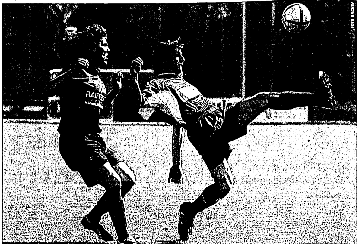
Auch morgen Samstag ist seitens des USV voller Einsatz gefragt, will man gegen den FC Beringen punkten.

Der heutige Gegner hat vor 14 Tagen zu Hause Leader Bülach mit 3:1 bezwungen, ein Kunststück, das auch dem wieder erstarkten Wehrle-Team am letzten Spieltag mit 2:1 gelang. Wir sehen also, sowohl der USV (24 Punkte) als auch der FC Beringen (22 Punkte) sind in ihrer Spielstärke in etwa gleich einzustufen. Beringen kann auf 5 Siege und 7 Unentschieden mit einem Torverhältnis von 21:21 verweisen, der USV auf 7 Siege und 3 Unentschieden bei einem Torverhältnis von 35:29. Ein Vorteil für die Liechtensteiner Unterländer? Bei weitem nicht! Denn Beringen gilt als unkonventionell spielende, starke und aggressive Elf, welche mit sieben Unentschieden zu den Remiskönigen zählt. Ob dieses Vorhaben auf dem beengten Nebenplatz im Sportpark so einfach möglich sein wird, ist fraglich.