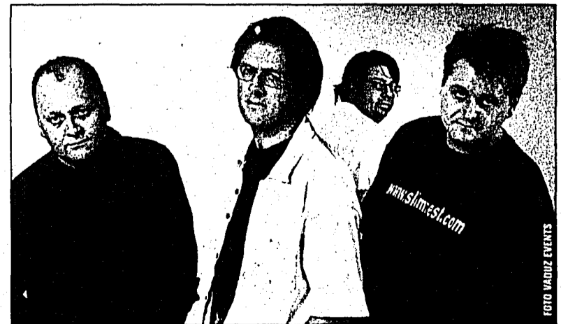
Vaduz tanzt morgen Samstag ab 20 Uhr in der Flaniermeile. Im Bild: Slimfäst and the weight watchers live.