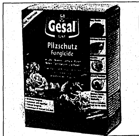
Neuer, regenfester Pilzschutz schont Vögel und Bienen.

ALLSCHWIL – Sowohl der Profi als auch der Hobbygärtner strebt bei Beeren, Obst, Gemüse und Zierpflanzen nebst einem guten Ertrag auch eine hohe Qualität der Ernte und die Gesunderhaltung der Pflanzen an. Dass es jetzt einen regenfesten Pilzschutz mit lang anhaltender Wirkung gegen eine grosse Anzahl von Schadpilzen gibt, ist eine grosse Hilfe. Das Fungizid gilt ebenso als sicher gegenüber Vögeln und Bienen. Als modernes Pilzschutzmittel mit lang anhaltender Wirkungsdauer gegenüber einer Vielzahl von Schadpilzen, wie z. B. Echter Mehltau, Rost, Schorf, Monilia, Blattfleckenpilze ist das Produkt bei allen Sorten von Früchten, Blättern sowie auch in den empfindlichen Entwicklungsstadien hervorragend verträglich. Gesal Pilzschutz Flint ist erhältlich bei Coop, Jumbo, Landi, OBI, Hornbach und in ausgewiesenen Gartengeschäften.