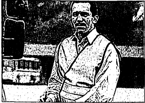
Die Sicherheitsweste ist bei der Marxana in Eschen erhältlich.

ESCHEN – Wer mit dem Auto in Italien unterwegs ist, benötigt seit dem 1. April 2004 eine Sicherheitsweste. Die sehr leichte, leuchtorange Weste mit Klettverschluss für variablen Verschluss ist erhältlich bei Marxana, Essanestrasse 65 in Eschen.