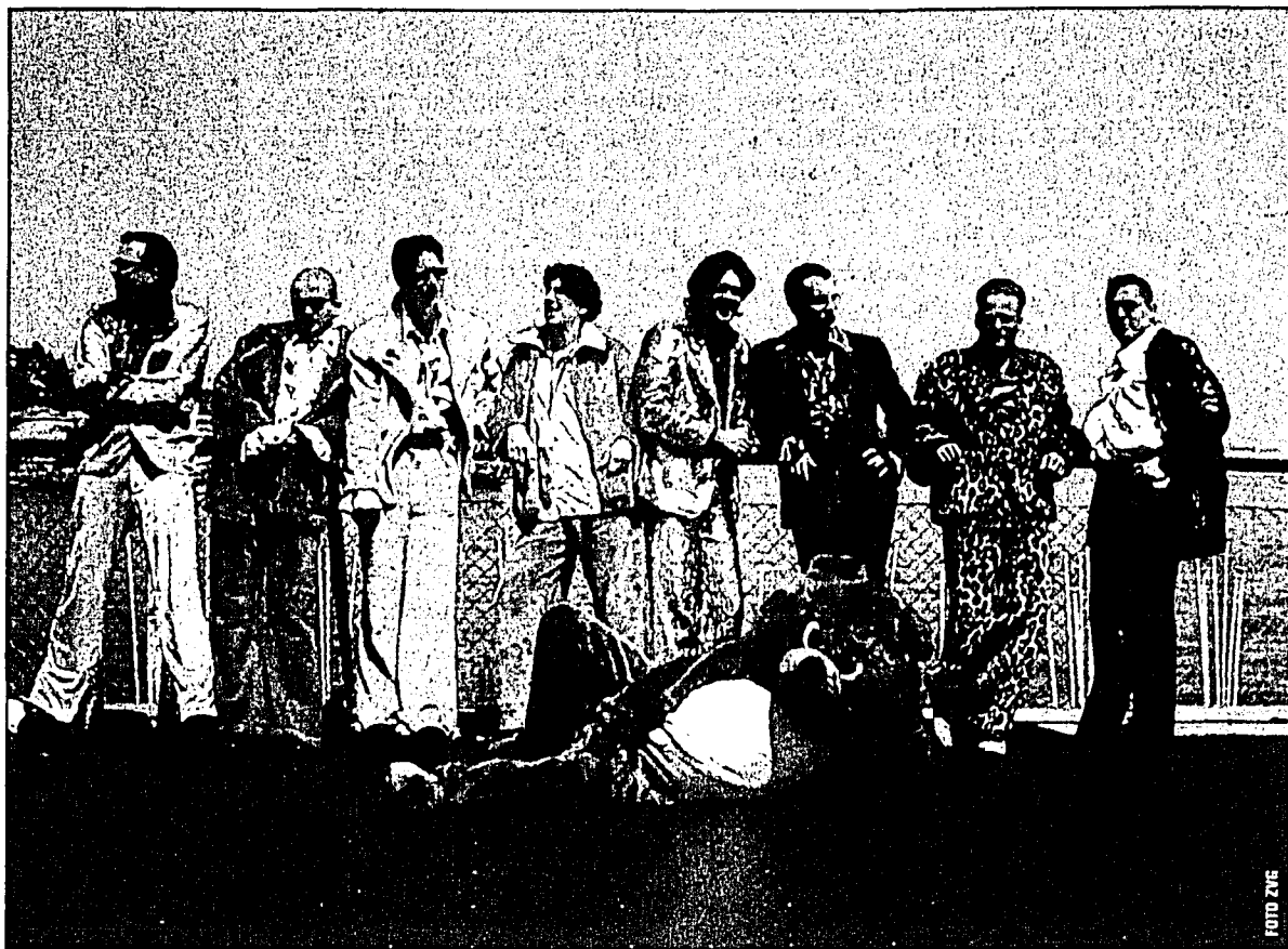
Sie feiern unter dem Motto: «Schlager macht schön» – ihr fünfjähriges Jubiläum. Dr. Schlager und die Kuschelbären.

Wie jedes Jahr haben sich die «Kuschelbären» auch heuer wieder ein Motto für ihre Tour ausgedacht. Nach den erfolgreichen Vorläufern, «Du bist nicht alleine 2002» und «Hab Sonne im Herzen 2003», ist das Jubiläumskonzert im Mai der Auftakt zur «Schlager-macht-schön-Tour 2004», in deren Rahmen es noch einige tolle Auftritte geben wird, wobei jedoch das Geburtstagsfest