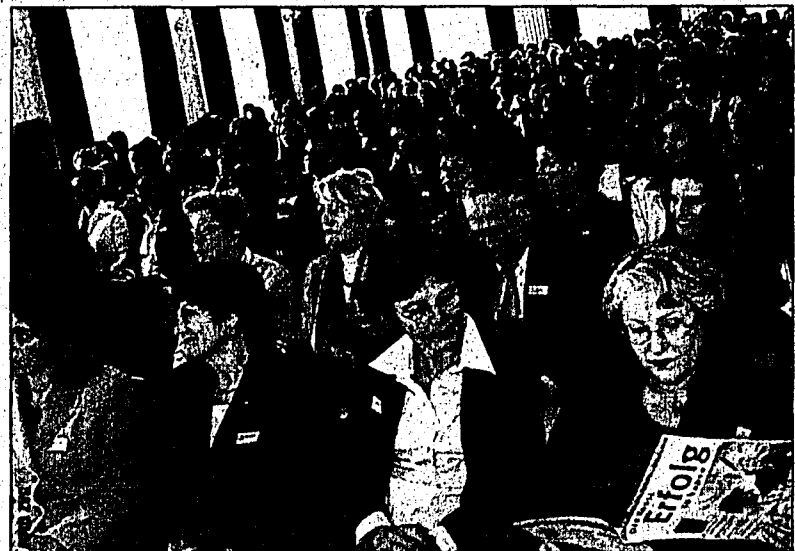
Der Kursaal in Bad Ragaz war bis auf den letzten Platz gefüllt. Die zweite KMU-Frauentagung wurde begehrt aufgenommen.