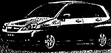
Liana 1.6 GL Top 4x4 Fr. 22 890.-*