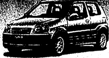
Ignia 1.5 Sport Fr. 18 990.-*