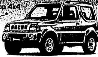
Jimny Wagon 1.3 JLX Fr. 19 990.-*