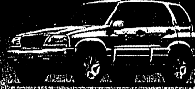
Grand Vitara 2.0 Wagon Top Fr. 28 990.-*