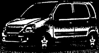
Wagon R+ 1.3 GL Fr. 13 990.-*