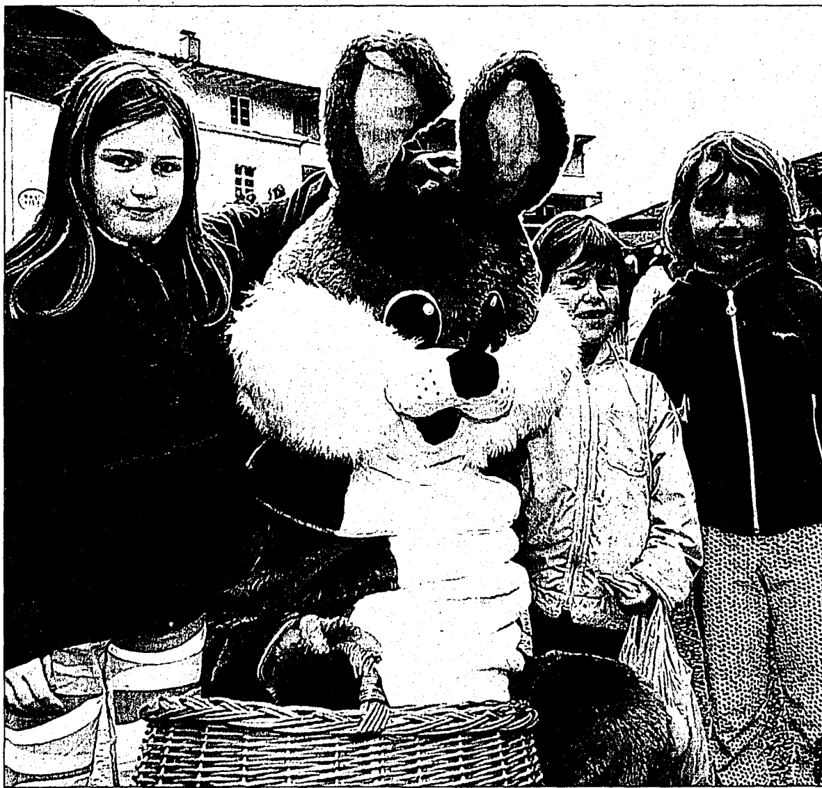
Am Samstag findet im Vaduzer Städtle der Frühlings- und Ostermarkt statt.

Bei der Rathausbühne ist speziell für Kinder ein betreuter Osterbasteleckeplausch angesagt. Ob ein Osterkörbchen geflochten, Osterzauberblumen gebastelt oder ein Eiermobil hergestellt wird, bleibt der Fantasie der Kinder überlassen. In einer Schminkecke dürfen sich die Kinder auch selbst bemalen. Ein Märchenkarussell auf dem Rat-