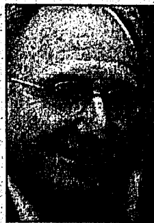
Regierungsrat Hansjörg Frick:

Mit der Öffnung der Märkte kommt den Wirtschaftsverbänden eine zentrale Bedeutung zu. Aufgaben, wie die Vernetzung mit internationalen Institutionen, die Vertretung des Wirtschaftsstandortes, der Einsatz für intakte Rahmenbedingungen und die Schaffung von Weiterbildungsmöglichkeiten, können effizient nur durch eine Interessensvertretung wahrgenommen werden. Sowohl die Mitgliedsunternehmen als auch der Wirtschaftsstandort können von einer professionellen, dienstleistungsorientierten GWK profitieren.