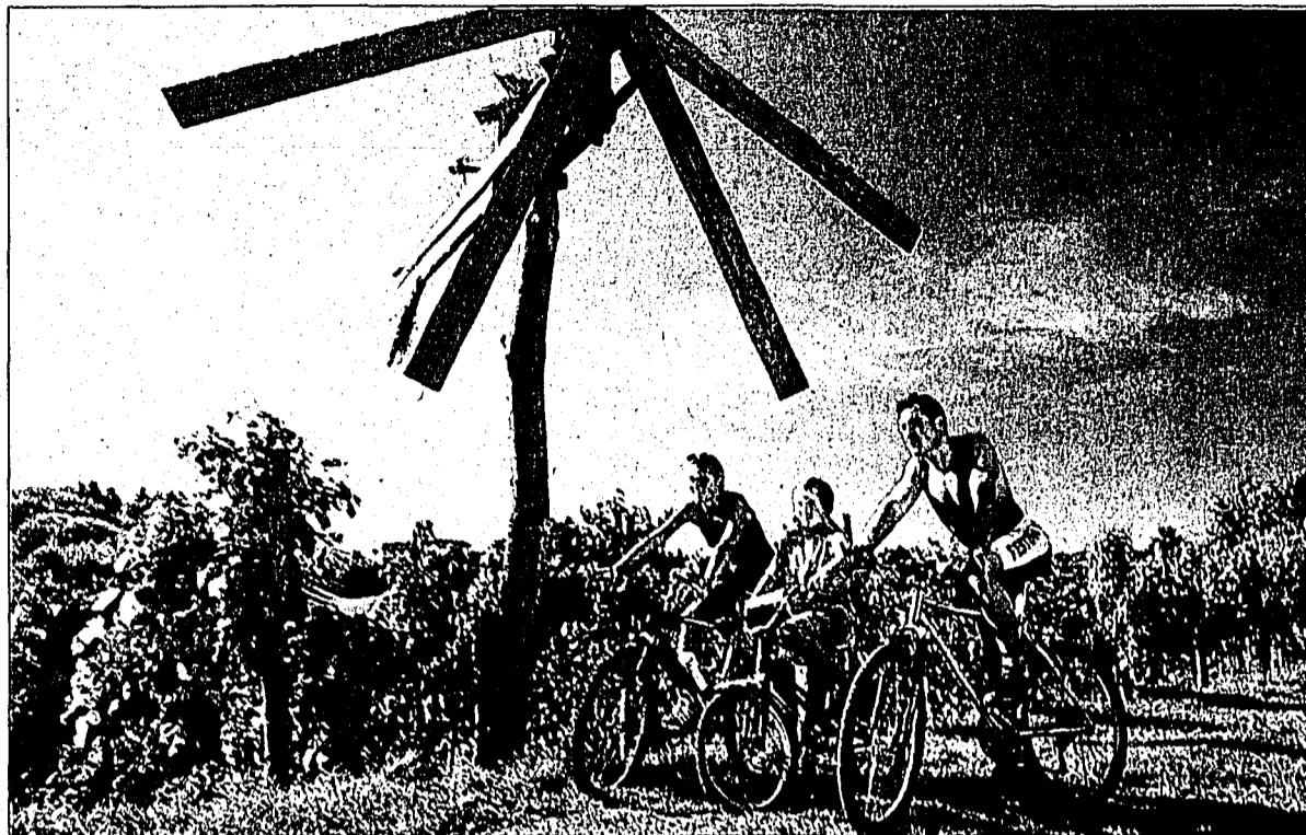
Unter www.fahrradreisen.at kann man sich die schönsten Radrouten Europas anschauen.

Suchen und buchen unter www.fahrradreisen.at