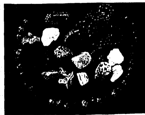
Noch bis am 10. April gibt's auf das gesamte Steinsortiment Frühjahrsrabatt.

Das Steinlädli in Nendeln ist im Oberstädtle 30 (bei der Engelkreuzung bergwärts), Telefon 373 16 57.