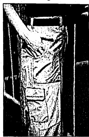
Eisenstein zeigt exklusive Produktneuheiten für den sportlichen Outdoorbereich.

Schoeller Switzerland ist der Garant für erstklassige Qualität, neueste Technologien und aussergewöhnliche Funktionen.