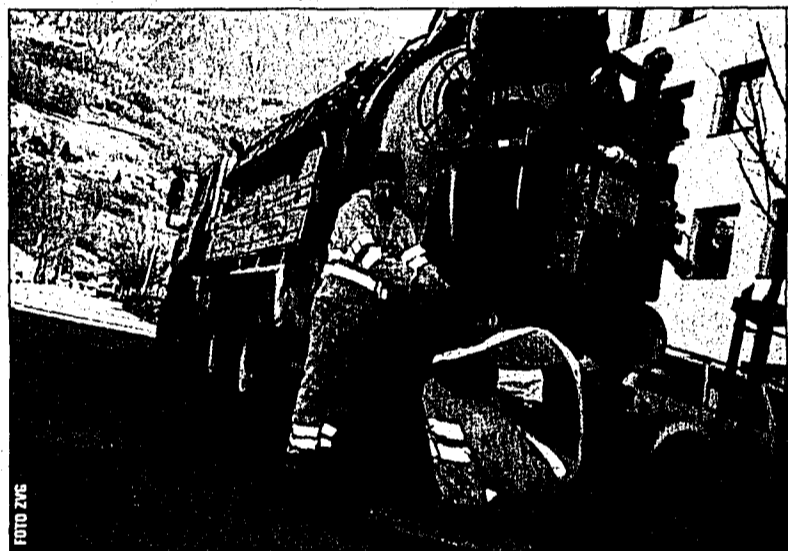
Fachmännische Kanalreinigung trägt wesentlich zur Werterhaltung von Liegenschaften bei.

VADUZ – Jeder kennt sie, fast täglich sehen wir sie: Die durch ihre Hausfarbe – ein kräftiges Orange – auffallenden Fahrzeuge und Mulden der Firma «Risch reinigt Rohre AG, Vaduz». Aber nur die wenigsten wissen, was passieren würde, wenn die «Männer für alle Fälle» ihre Arbeit eines Tages niederlegen würden.