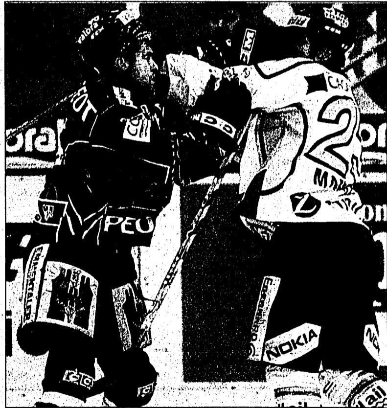
Voll zur Sache ging es beim Spitzenspiel: Christian Dube (li) vom SCB und Mike Maneluk von Lugano liessen die Fäuste sprechen.

Gegen einen desolaten HC Lausanne kam Basel zum 2. Auswärtssieg im 23. Spiel und dem ersten seit dem 27. September in Zug. Die Leistung der Einheimischen beim 1:7 grenzte an Arbeitsverweigerung. In dieser Form ist Lausanne