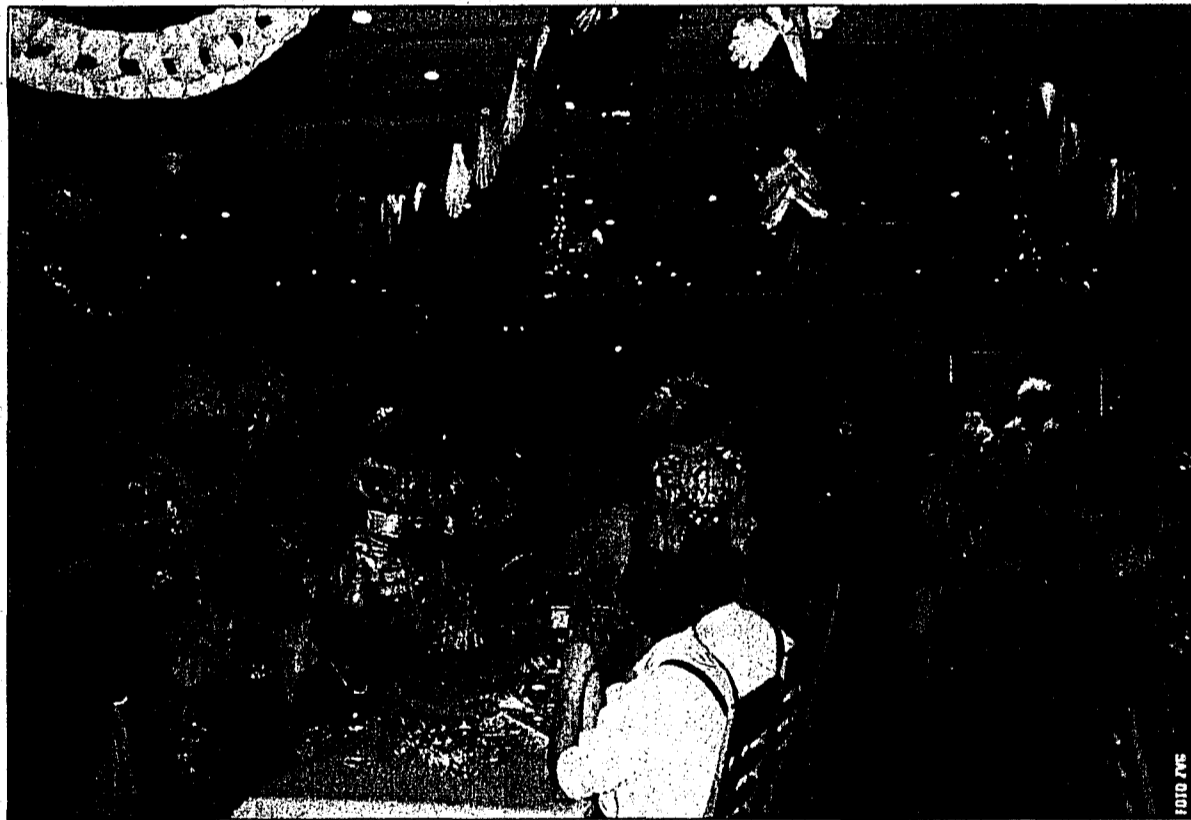
Die Seniorinnen und Senoren des Betagtenwohnheims St. Florin Vaduz feierten dem «Schmutzigen Donnerstag» gemeinsam mit dem Personal.

Die Betreuerinnen und Betreuer zeigten auch mal ihre verborgenen Tale und unterhielten mit Sket- chen und humorvollen Einlagen. Die Stimmung stieg und es wurde viel gelacht und auch getanzt, aber