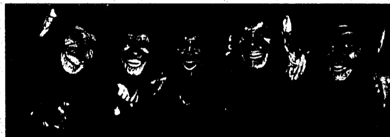
Absolut angesagt: Als Gruppe verkleidet durch die Fasnacht.

Du musst wissen, was läuft. Vieles geht, vieles nicht. Eine unvollständige Auswahl findest Du im In-&-Out-Kasten.