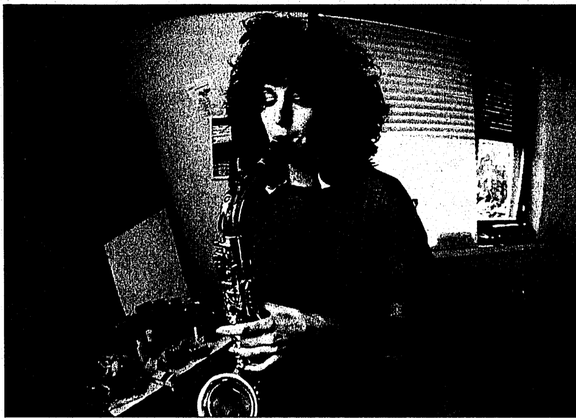
Die Userinnen und User können ihre selbst komponierte Musik an Musenalp einsenden – alles wird veröffentlicht.

www.musenalp.com ist damit multimedial geworden. Per Mail oder per Post können die User/-innen ihre selbst komponierte Musik – egal in welcher Form (von der einfachen analogen Musikkassette bis zu digitalen Files jeden Formats, ob mit oder ohne Gesang) – an Musenalp einsenden. Die Musik wird dann in mp3-Files konvertiert und aufs Musenalp-Portal geladen.