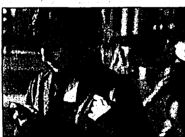
Konsumentenschützer kritisieren SMS-Preise.

Die kleinen Textmeldungen, die mit dem Mobiltelefon verschickt werden können, seien für die Betreiber eine wahre Goldgrube, schreibt die Konsumentenorganisation in einem Brief an die Wettbewerbskommission. Der technische Aufwand sei gering. Gemäss einer französischen Studie koste ein SMS den Anbieter nur etwa 3 Rappen. Gemäss der Fernmeldestatistik des Bundesamtes für Kommunikation sind im Jahr 2002 3,016 Mrd. SMS verschickt worden. Bei einem durchschnittlichen Preis von 20 Rappen erwirtschafteten die Mobilfunkbetreiber