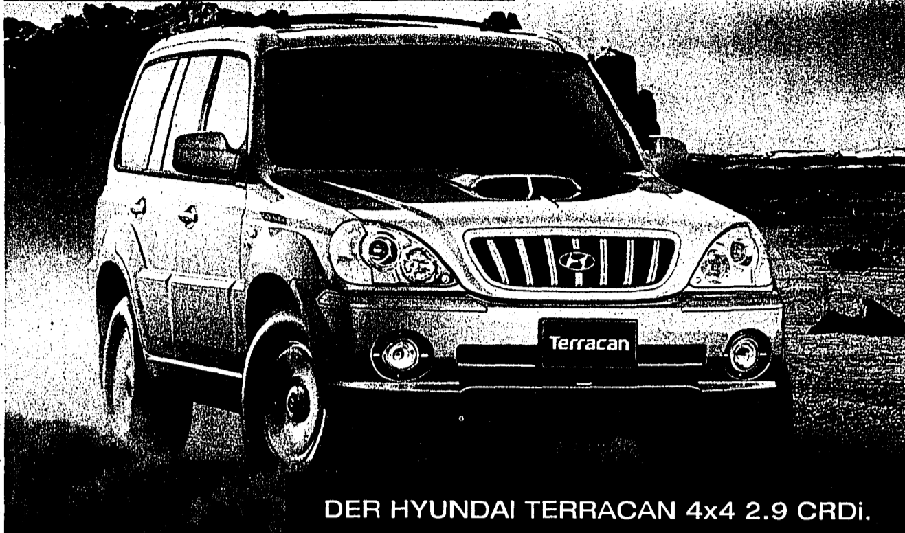
DER HYUNDAI TERRACAN 4x4 2.9 CRDi.