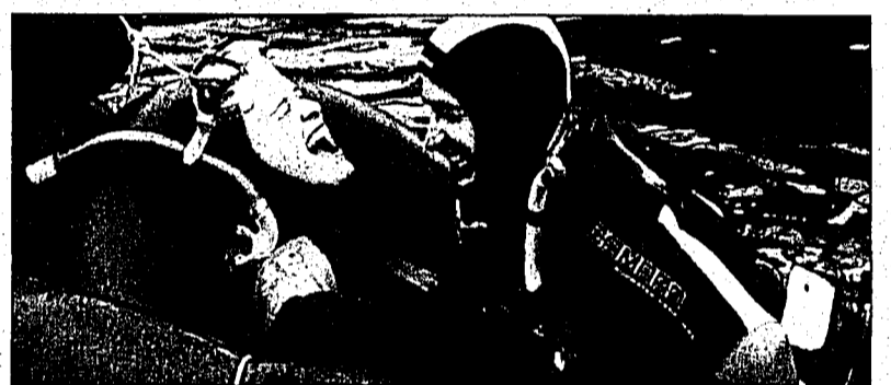
Dreikönigsschwimmen des Tauchclubs Bubbles war einmal mehr ein voller Erfolg.