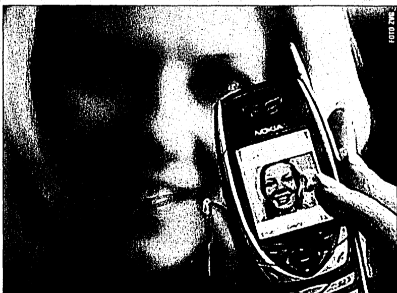
In den USA gibt es bereits Orte, wo Kamera-Handys verboten sind.