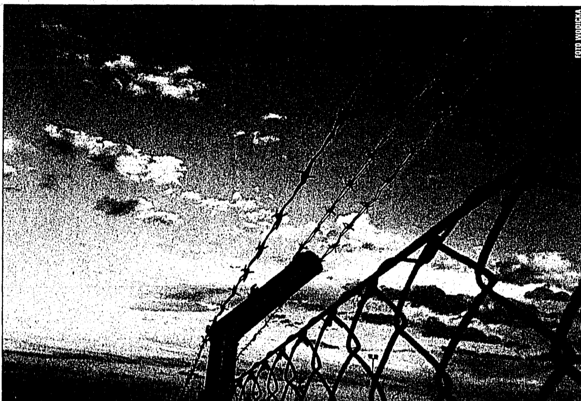
Das Projekt «e-Learning» soll Häftlingen auch hinter Gittern den Zugang ins Internet ermöglichen.

Strafvollzug: Flt für den Arbeitsmarkt durch E-Learning