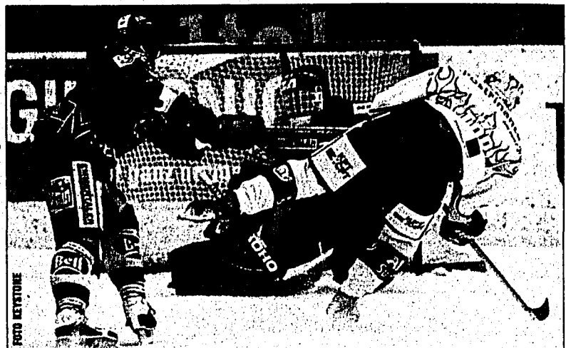
Der SC Bern rückt dem HC Lugano immer mehr näher.

Davos errang beim 7:1-Kantersieg in Basel den höchsten Auswärtserfolg in der Nationalliga A seit einem 9:1 gegen La Chaux-de-Fonds am 16. Januar 2001. Die Linie um Todd Elik schaltete und waltete in Basel nach eigenem Gutdünken. Elik Sturmpartner Jonas Höglund gelang dabei der erste Hattrick in