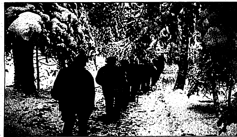
Die Seniorinnen und Senioren des LAV wandern am 8. Januar.