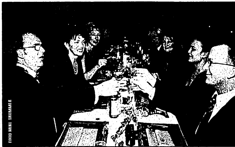
Fröhliche Stimmung herrschte am Dienstag in Triesen.