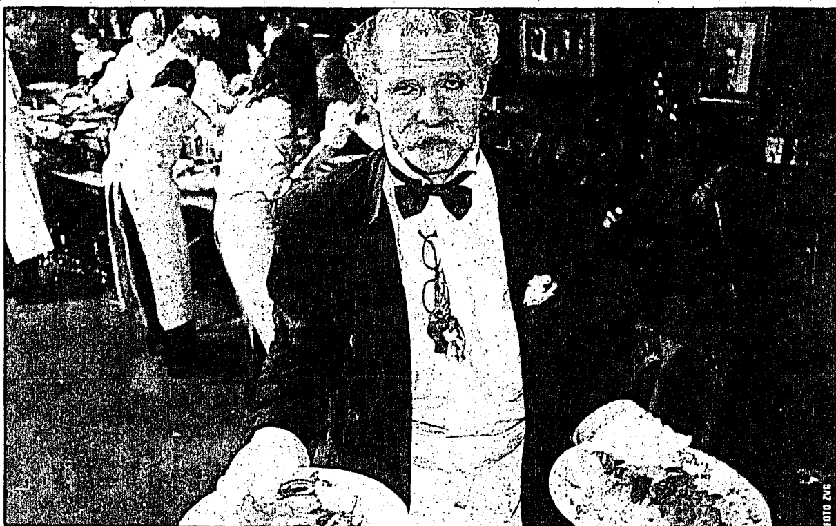
Ein Dinnerspektakel der besonderen Art bieten «Clowns & Kalorien» Anfang Januar in Buchs.